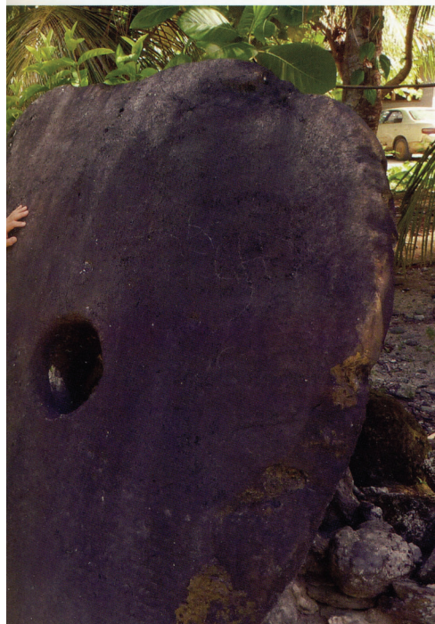
南海の孤島ヤップで

その背後には見失った価値が存在する。情報と一言で表現するが、そこには極端に性質の相違する二種の情報が存在する。企業の投資計画のように少数の人間が独占するほど価値が増大する情報と、音楽の流行作品のように多数の人々が共有するほど価値が増大する情報である。