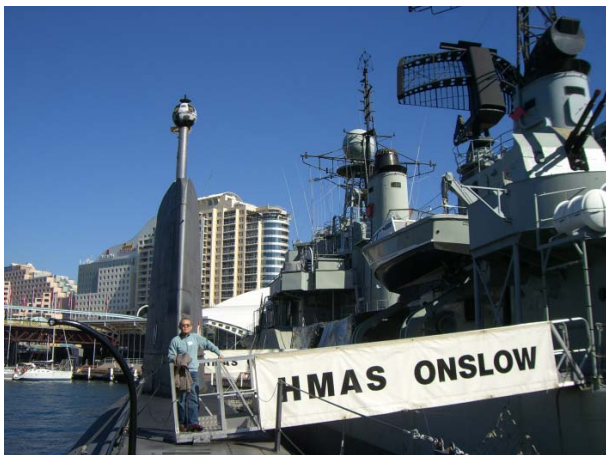
図 1 会場周辺

会場は港に面した大変美しいところであった。東京の江東区隅田川沿いのいわゆるウォーターフロント再開発地区のモデルにしたところとことで、確かによく似た雰囲気が感じられた。港にはマリン博物館が有り、退役した駆逐艦や潜水艦等が係留されていた。(図 1)