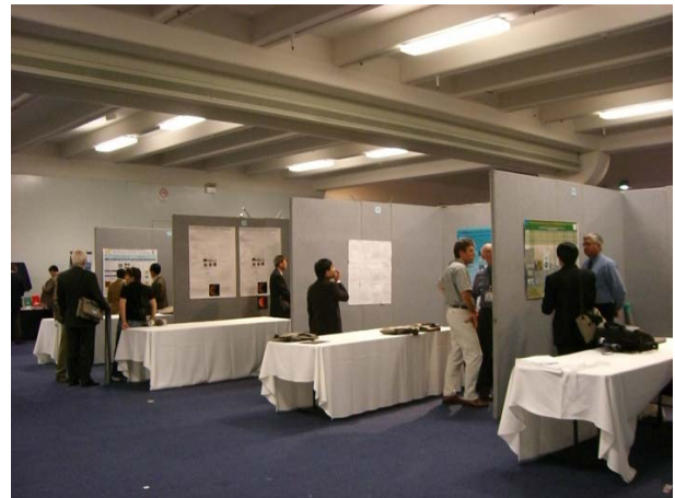
図 2 ポスターセッション会場状況

各分野の投稿論文数を論文数の多い順にまとめて表 1 に示した。混相流は投稿論文数 58 件であ