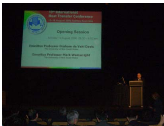
図 1 開会式の様子

今回の国際伝熱会議も「伝熱オリンピック」と称されるに相応しく盛大であったが，4 年前と比べ全般的に「伝熱」のスコープが拡がり，内容的にも新しい動きが目立った会議であった。また，オペラ鑑賞やディナークルーズなど種々のソーシャルプログラムも企画されて，楽しい会議であった。