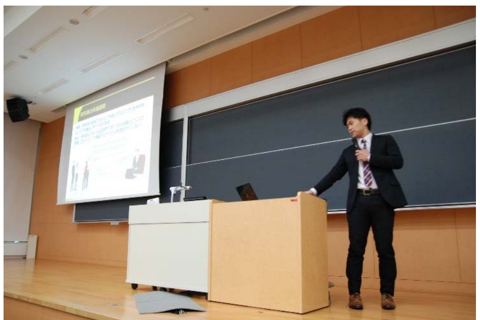
ソフトウェア品質シンポジウムでの発表@東洋大学

また、この時の経験を基に社会人4年目の時には日本科学技術連盟主催のソフトウェア品質シンポジウムと言う場で論文発表も行いました。学生の頃の学会発表は理論の実証のための場でしたが、社会人のシンポジウムだと実務面にどのように貢献できるかの発表という点で同じ論文発表と言っても中身が大きく異なることも感じました。