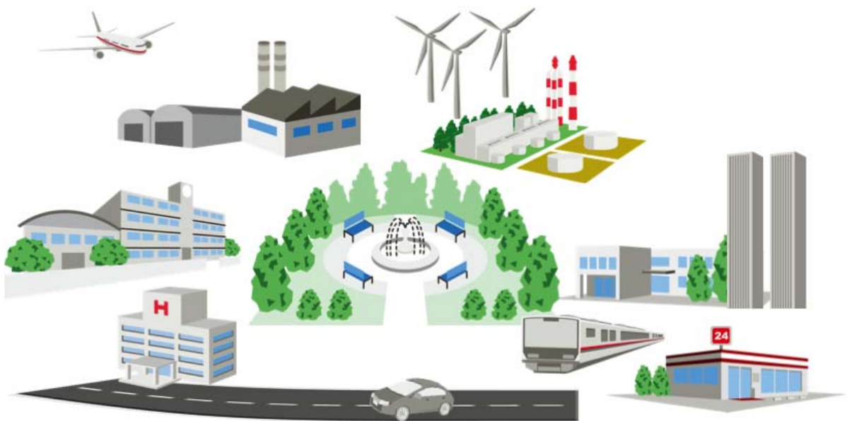
ICT技術が支える社会インフラ

しかしお客様の会社名を見るとトヨタ自動車や川崎重工、島津製作所など、京機会の人が就職する会社も多く、機械理工の思考力は必要になります。また、世の中の社会インフラを支えるためにはICT技術が必要となり、世の中の社会インフラを支える会社としてのやりがいを感じられると思います。