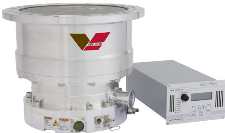
磁気軸受形ターボ分子ポンプ

分子の密度が一定以下になり、分子同士の衝突よりも壁との衝突の方が支配的になった圧力領域を分子流領域といいます。分子流領域において、ある翼角度をもったタービンが高速で回転すると、その翼速度が分子の平均速度に近い場合、翼に衝突した気体分子に一方向の運動エネルギーを与えることになります。これによって気体は一方向へ向かって圧縮され、タービン翼が多段であれば翼の段数の累乗分の圧縮率を持つこととなります。ターボ分子ポンプは上記の原理を利用した、分子流領域における圧縮器であり、粘性流領域をカバーするポンプと直列に運転することで超高真空までの真空域で動作できる機械ポンプです。