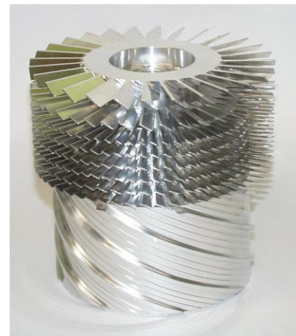
ターボ分子ポンプのロータ