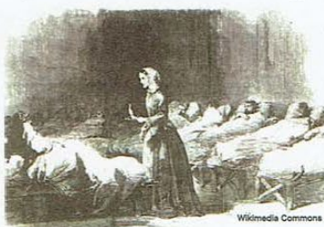
図3 戦地の病院でのナイチンゲール

凄惨なクリミア戦争 現在のトルコの領土の主要部分であるアナトリアに一九九九年に成立したオスマン帝国は急速に版図を拡大し、一七世紀後半には地中海東半分の周囲全体を領土とする大國に発展してきました(図1)。そのオスマン帝国の版図が最大になった時期に北方に出現したのがロシア帝國でした。ギリシャ正教を國教とするロシア帝國とイスラム教國であるオスマン帝國は黒海の北側やバルカン半島の北側の國境で緊張した状態になります。