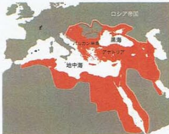
図1 オスマン帝国の版図 (1683)