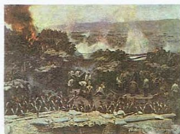
図2 セヴァストポリの戦闘